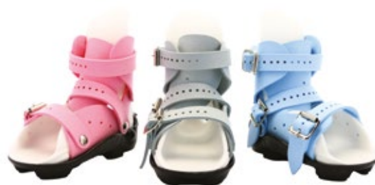
Disponible en 3 colores

Sus materiales son hipoalergénicos y libres de látex, siendo muy bien tolerados.