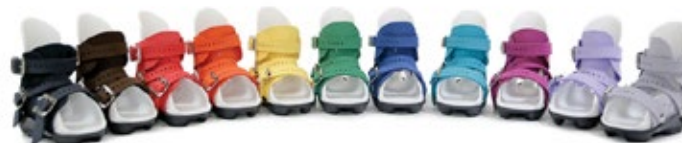
Gran variedad de colores

Disponibles en 10 y 15° de dorsiflexión. Usualmente se recomienda que la longitud de la barra sea igual al ancho de hombros del paciente. La talla extra corta se puede cortar hasta 11 cm bajo pedido.